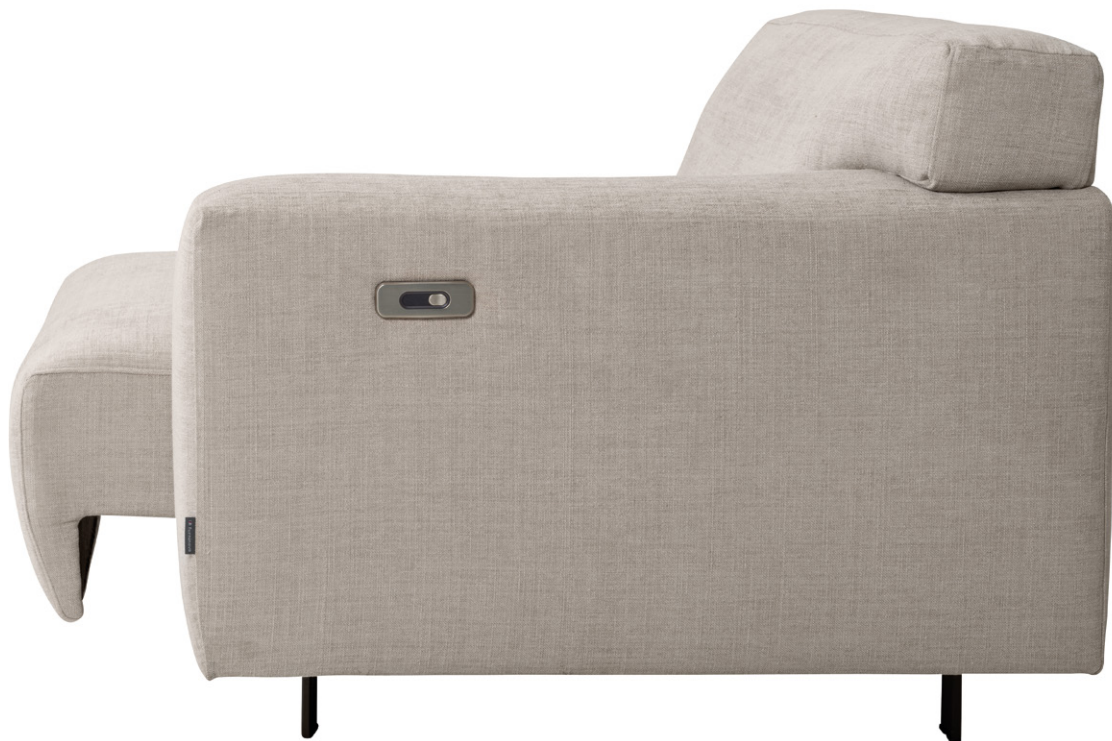
Vesta Motion 1,5 R