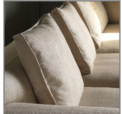
Poduszka Dusk dostępna w skórze lub w tkaninie. Występuje w wersji Standard i Special. Dostępna w komfortach CEU i C2.

MTI-Furninova Polska Sp. z o.o., ul. Zbożowa 6, 11-400 Kętrzyn tel. 89 751 32 65, e-mail: info@mti-furninova.pl